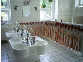
Waschbeckenanlage von Rotter

Umfang: Planung und Bauleitung der Heizungs- und Sanitärinstallation für Ausbau Dachgeschoss