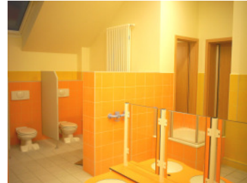
Waschbeckenanlage von Kemlit