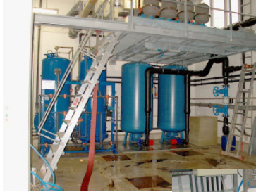
Kiesfilter und Druckhaltung für Scheibenfilteranlage

Umfang: Planung und Bauleitung einer Brauchwasserfilteranlage (Wasserdurchsatz 100.000 m 3 /h) mittels Scheibenfilter, einschl. Druckhaltestation Planung und Bauleitung Reinraum Klasse 10.000 mit Klimaanlage 30.000 m 3 /h und Kälteanlage 500 kW Kühlleistung Planung und Bauleitung einer Pumpstation für galvanische Abwässer und einer Technologischen Abluftanlage für Galvanikanlagen