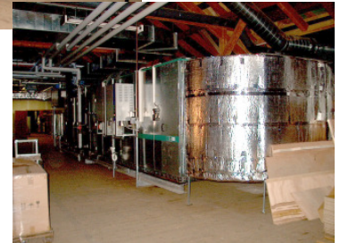
Klimagerät mit Dampfbefeuchter für Reinraum Klasse 10.000