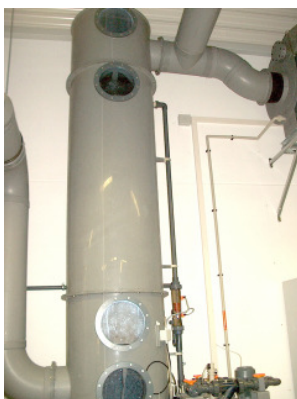
Abluftleistung 2.000 m 3 /h