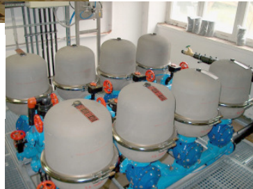
Scheibenfilter für Wasserdurchsatz 100.000 m 3 /h