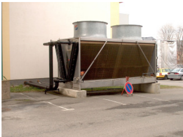
Hybridkühler 610 kW