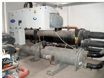
Kaltwassersatz 500 kW