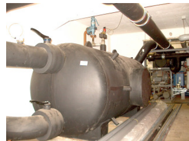
Pufferspeicher 3000 l