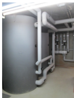
Pufferspeicher 2 x 1400 l