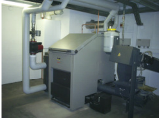
Köb-Holzkessel 100 kW

Umfang: Planung und Bauleitung Umbau Heizzentrale mit 100 kW-Holzbrikettkessel mit Lagerbehälter und 100 kW-Gas-Brennwertkessel als Ersatz bei Brennstoffmangel durch selbst erzeugte Holzbriketts