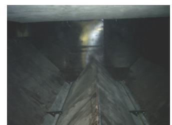
Förderschnecken im Pelletlager