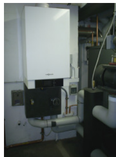
Gas-Brennwertkessel 100 kW bei Brennstoffmangel