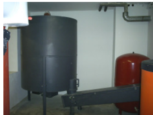
Lagerbehälter für Holzbriketts mit Fördereinrichtung