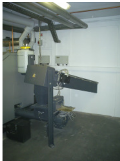
Trogförderschnecke für Holzbriketts