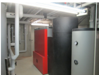
Fröling Pelletkessel 80 kW mit Saugzyklon und Saugturbine

Umfang: Planung und Bauleitung der Umstellung Heizzentrale von Heizöl auf Pelletkessel 80 kW mit Trinkwassererwärmung und Ausbau Pelletlager